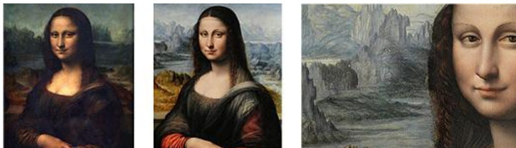
Слева: Леонардо да Винчи, справа:

Невероятно, но тем не менее правда: под слоем черной краски реставраторы музея Прадо в Мадриде обнаружили совершенную копию Моны Лизы. Похоже, что эта сестра-близнец оригинала Леонардо была создана одновременно с ней и на том же месте.